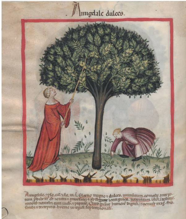
Fig. 2 Il mandorlo nel Tacuinum sanitatis (1380-1399, 1480)