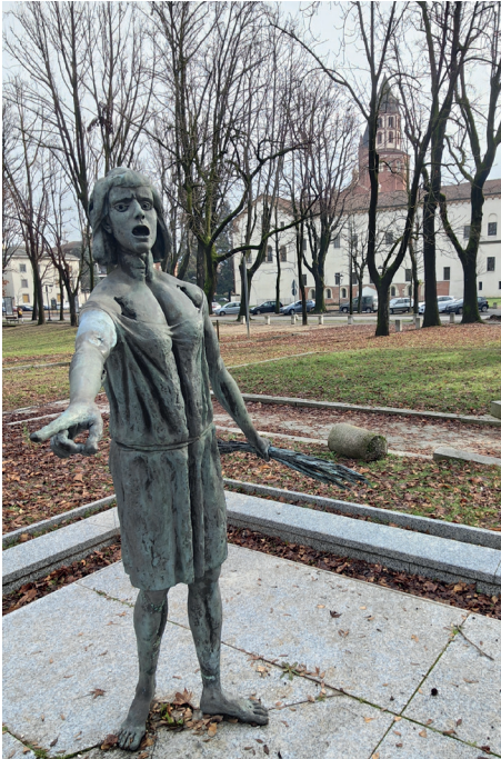
Monumento alla mondina di Agenore Fabbri, Vercelli (Wikipedia, licenza Creative commons)

Questa versione è talvolta indicata come antecedente alla più nota Bella ciao partigiana, ma le ricerche storiche hanno messo in evidenza che l'origine e il percorso di diffusione del brano restano controversi e non univocamente accertati 35 . In ogni caso, la versione partigiana ha trasformato il canto in uno dei simboli più conosciuti della Resistenza italiana, oggi interpretato in tutto il mondo come inno alla libertà e alla difesa dei diritti civili. Nel tempo, Bella ciao ha rinnovato il proprio significato in contesti sociali e politici diversi, assumendo una valenza universale che trascende il suo contesto storico originario.