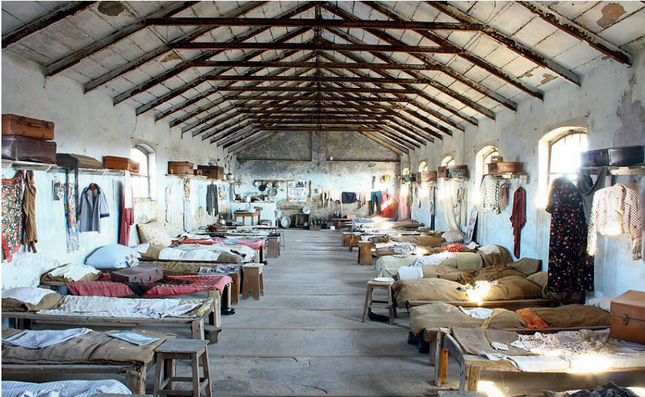
Interno di dormitorio (Museo delle mondine, Tenuta la Colombara, Livorno Ferraris - VC)

Il lavoro si svolgeva in squadre di otto-dodici donne, sotto la guida di una caposquadra, con turni giornalieri di dieci-dodici ore, continuativi, spesso anche sotto la pioggia battente. Brevi pause erano concesse solo per bere un po' d'acqua. Il controllo era rigido e ogni rallentamento poteva essere punito. Il ritmo del gruppo era serrato: nessuna poteva allontanarsi troppo, nemmeno per le proprie necessità fisiologiche.