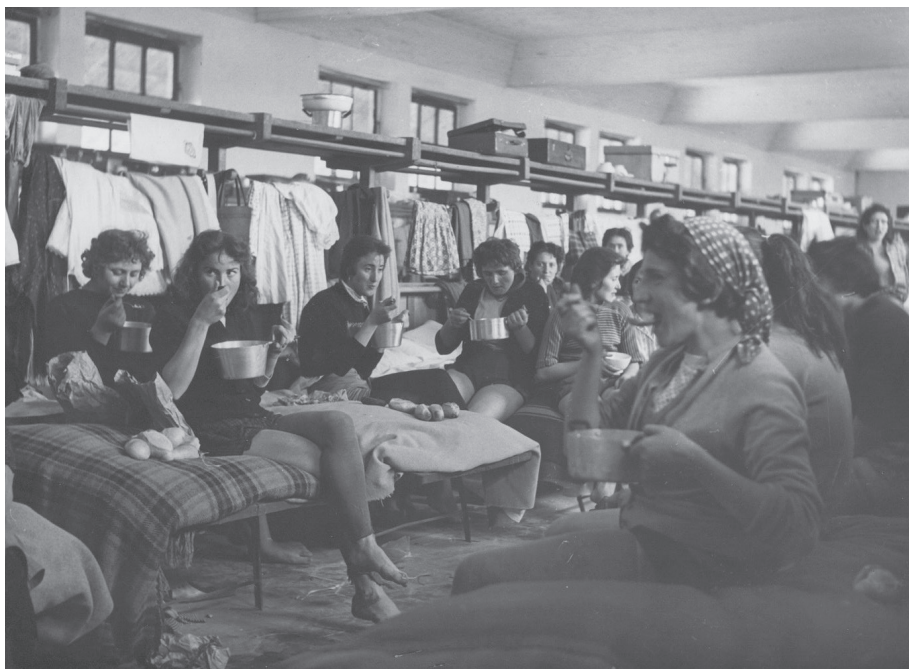
Pasto delle mondine in camerata

– a 10-15 lire alla fine degli anni Venti e fino a 110-115 lire al giorno nel 1945 13 . Era inoltre comune l'aggiunta di un chilogrammo di riso bianco per ogni giornata lavorativa 14 .