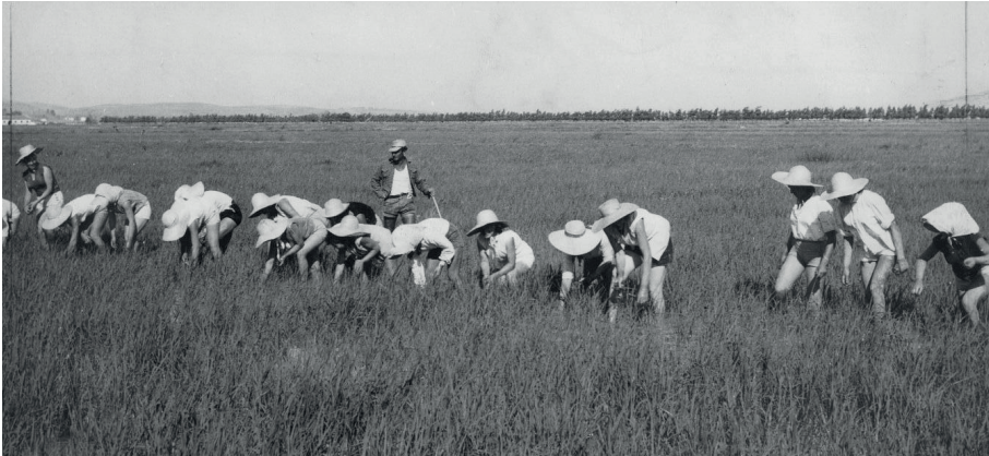
Monda del riso

pressioni sociali, difendere i propri diritti e mantenere una visione critica sulle ingiustizie economiche e politiche che influenzavano la loro vita quotidiana 26 . Un esempio eloquente è rappresentato dalla lettera aperta delle mondine di Livorno Ferraris, che nel 1915 rifiutarono di sostituire i braccianti maschi richiamati, esprimendo una presa di posizione fondata su un'analisi politica e concreta del conflitto, piuttosto che su una retorica femminile o materna 27 . La pubblicazione della lettera su La Sesia indusse molti a ritenere che l'ispiratore del documento fosse lo stesso fondatore del giornale e sostenitore delle mondine, l'avvocato Modesto Cugnolio 28 . Tali istanze furono oggetto di derisione da parte della stampa conservatrice, che le attribuì a influenze socialiste. Tuttavia, esse trovarono espressione e legittimazione nella prassi quotidiana e nelle forme culturali popolari, come attestato dai canti e dalle azioni collettive.