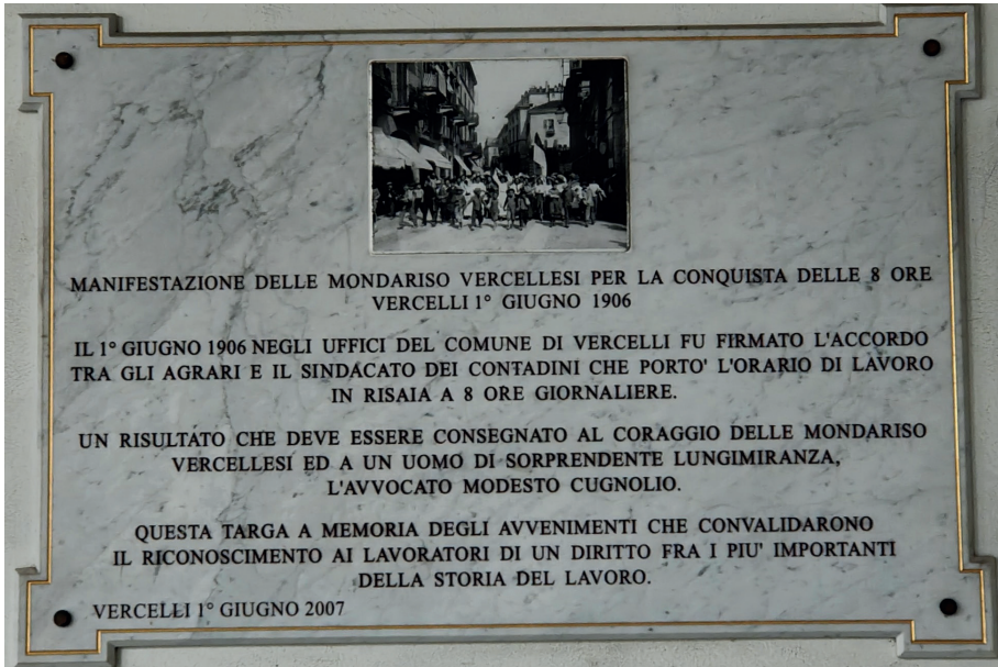
Targa a ricordo delle manifestazioni delle mondine del 1906 a Vercelli

popolare spinse il governo Giolitti a una strategia di mediazione; un anno dopo, le mondine ottennero l'approvazione della "Legge sulla risicoltura", che introdusse importanti tutele, tra cui la riduzione della giornata lavorativa a nove ore per le lavoratrici locali e a dieci per quelle provenienti da altre zone, nonché l'obbligo di stipulare contratti scritti 23 .