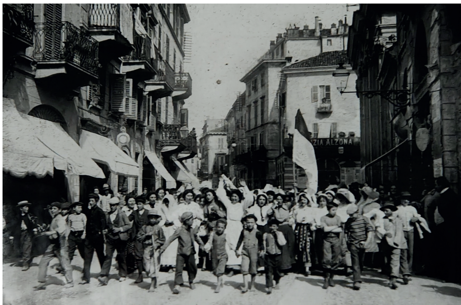
Manifestazione delle mondine nel 1906 a Vercelli

Nelle grandi aziende risicole del vercellese, le mondine si ponevano in prima linea contro l'oppressione padronale. Il malcontento si incanalò nelle prime leghe contadine e nei sindacati locali, con una mobilitazione sempre più determinata. Gli scioperi delle mondine ebbero un effetto più incisivo rispetto a quelli di altri lavoratori, sia per le conseguenze economiche arrecate alle produzioni risicole, sia per la forza espressiva e determinazione delle loro forme di protesta 21 . Le loro rivendicazioni si concentrarono soprattutto sulla riduzione dell'orario di lavoro, da quattordici a otto ore, istanza che si tradusse anche nei canti popolari come "Se otto ore vi sembran poche", divenuto inno del movimento bracciantile.