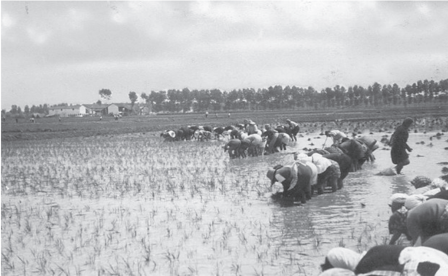
Trapianto del riso

tine, disposti in file regolari con una distanza media di 20-25 cm tra le file e 15-20 cm tra i punti d'impianto lungo ciascuna fila. Il trapianto, eseguito dalle mondine, richiedeva grande abilità: la lavoratrice prendeva con la mano sinistra un mazzetto di piantine (raccolto nel vivaio) dal quale, con il pollice e l'indice della mano destra, prelevava un ciuffo di 3-5 piante da inserire nel terreno con l'ausilio delle altre dita. Questa operazione veniva effettuata retrocedendo 4 .